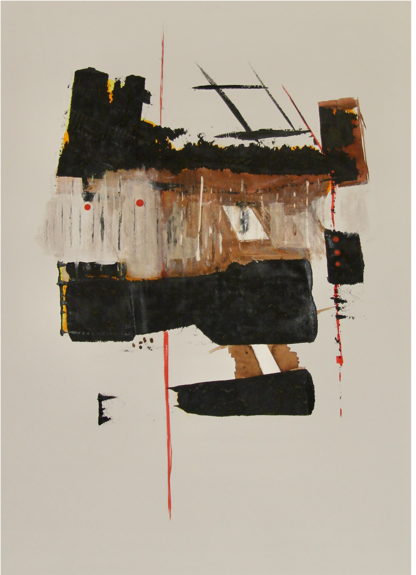
"R v rence" Mixed media on paper _ 75x60cm