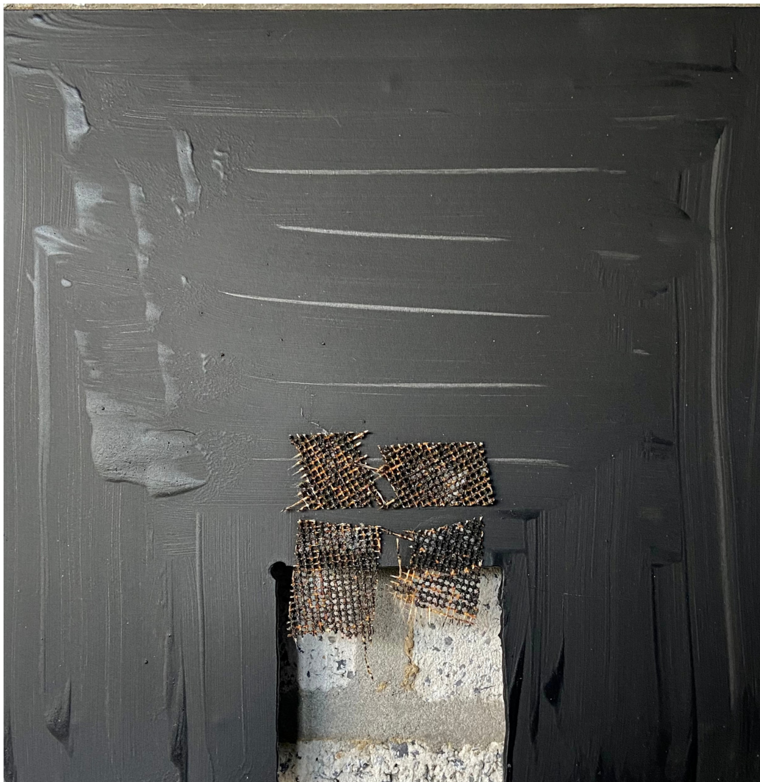
"Chute" 21x21cm techniques mixtes. Matériaux mixtes et de récupération