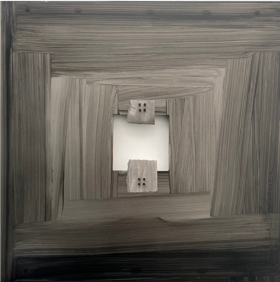
“Cent” 50x50cm techniques mixtes -matériaux de récupération