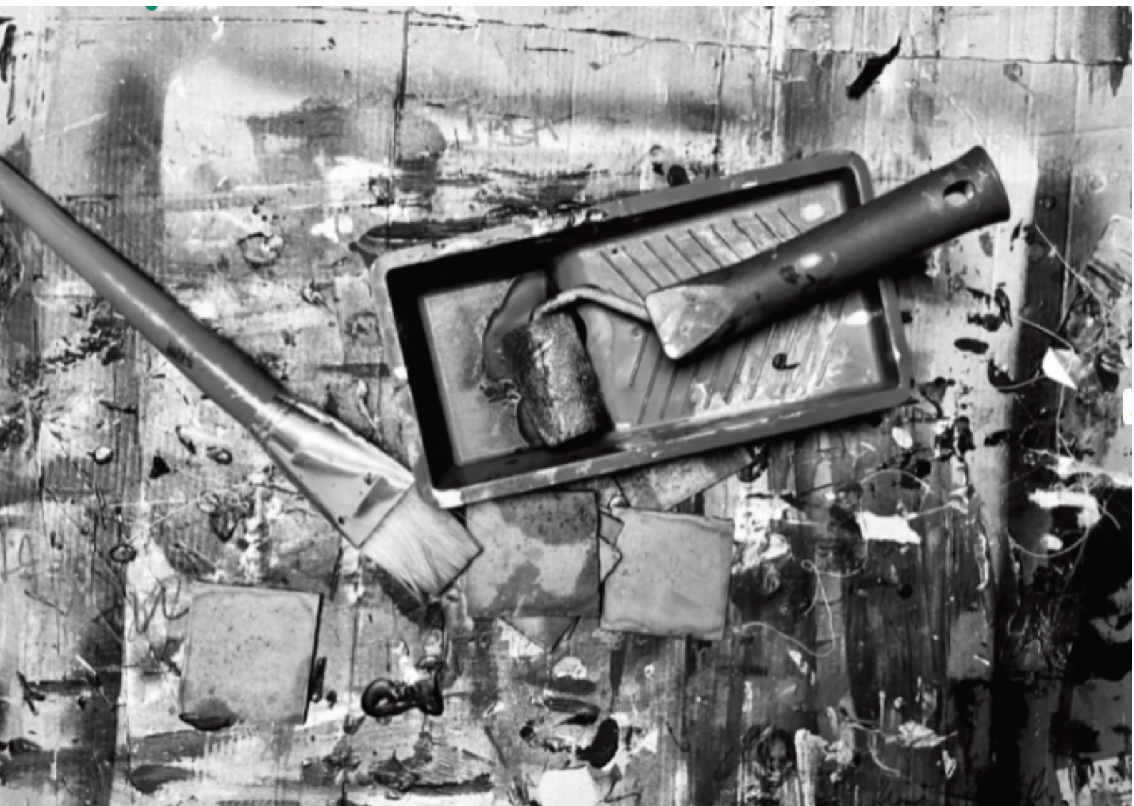
Vue plongeante sur le table de travail dans l'atelier de l'artiste Véronique Cordonnier